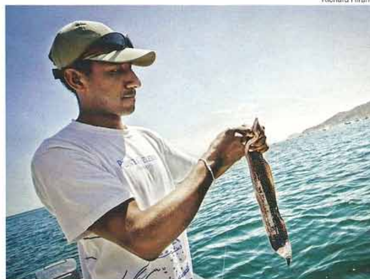
FRUTOS DEL MAR. SALIENDO DESDE EL MUELLE DE LOS ÓRGANOS SE PUEDE REALIZAR UNA PEQUEÑA EXCURSIÓN DE PESCA POR LAS CALETAS ALEDAÑAS. EN LA FOTO, UNO DE LOS PECES QUE MORDIÓ EL ANZUELO.

El pueblo de Los Órganos es otra excelente opción para quienes